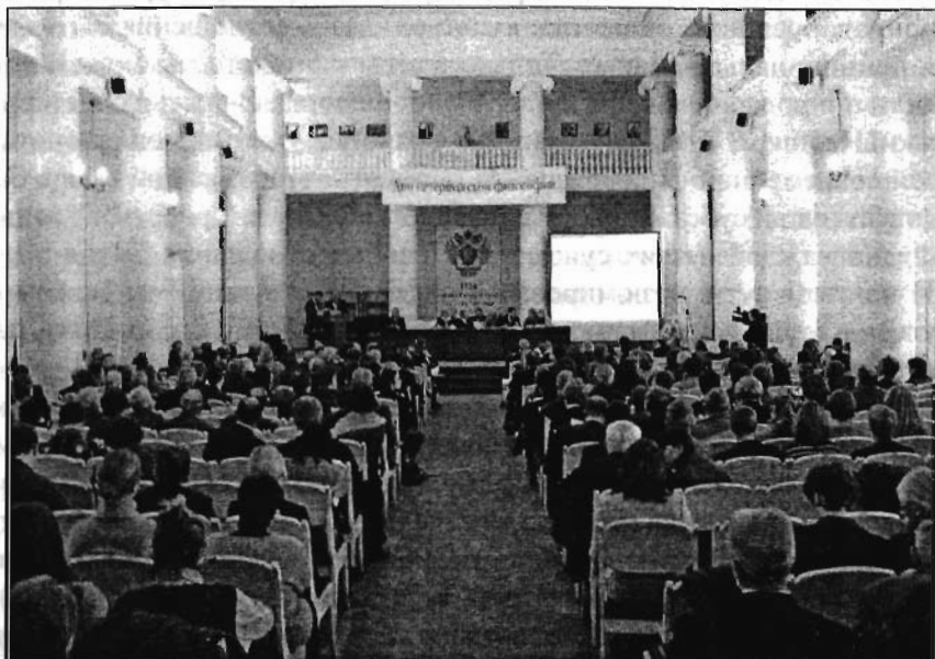
"Дни Петербургской философии" 19–20 XI 2004 г.

Неужели вот теперь и настали времена "последнего поэта"? Нет, сам Александр Кушнер так не считает, поскольку всякий раз выясняется, что поэт может быть, по его словам, только "предпоследним". Почему сегодня поэзия не востребована, почему не читают сегодня? Что произошло? Значительная часть вины, считает докладчик, лежит на самих поэтах. Мы хотели получить свободу, мечтали избавиться от цензуры, да, все это произошло и это замечательно. А дальше получилось так, что любой человек, умеющий "накропать" стихи, считает своим долгом выпустить книгу, заплатив за это максимум 300 долларов. Читатель же не может разобраться в этом море графомании и выгащить действительно стоящего поэта. Но сегодня многие и настоящие поэты отказались в стихах от смысла, от знаков препинания. Происходит отказ от рифмованного стиха, когда из него вытекает музыка. Все это грустно. Но хотя сегодня есть масса свидетельств о том, что поэзия исчезает за ненадобностью, мне кажется, сказал А. Кушнер, что само бытие устроено поэтично, а потому ни с поэзией, ни с культурой в различных ее формах, ничего плохого не случится.