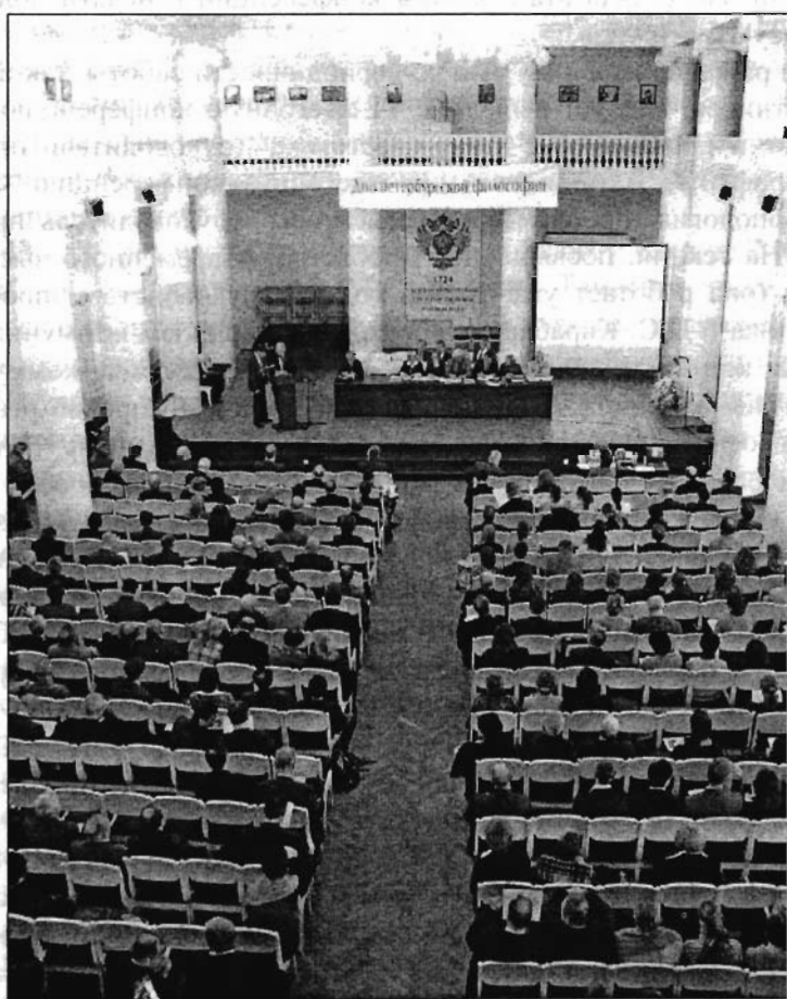
"Дни Петербургской Философии" 19–20 XI 2004 г.

имеет свой срок, не исключено, что в наших сообществах оно уже не живет, а только угасает. По мнению автора, современность вступила в череду бесшумных войн, карательных акций мирового гегемона, имя которому – капитал. А национальные государства, национальные интересы есть не более чем шапки-невидимки для глобальных гладиаторов и городов-архипелагов. Нужно понять, что претензия на экономику бесконечного есть другая сторона нашей действительной конечности – постольку всякий обмен есть, в сущности, аватары обмена смерти, и только преодоление смерти могло бы служить окончательному преодолению обмена. А поэтому нерепродуктивный эротизм и насильственное действие – одним жестом обрезавшие как натуральные, так и спиритуальные детерминации - дают нам возможность сопротивляться давлению реального и жить.